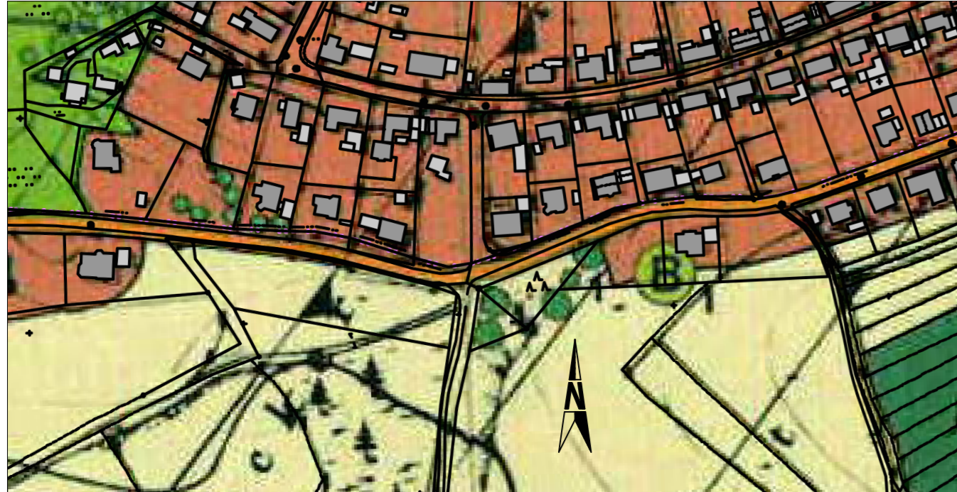
Rechtsgültiger Flächennutzungsplan vor der Änderung M = 1 : 2500